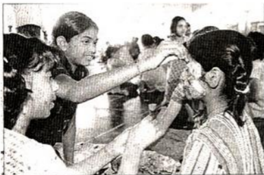
மாணவியின் முகத்தில் வண்ணம் தீட்டும் சக மாணவிகள்