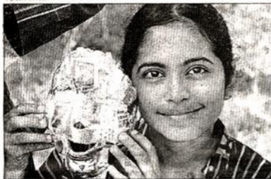
தான் தயாரித்த முகமூடியுடன் மாணவி.